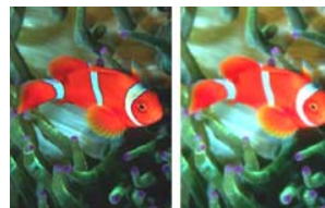
700cd/m 2 1,500cd/m 2

高輝度(1,500cd/m 2 )と高コントラスト3000:1というハイスペック液晶パネル。様々な明るさが想定される公共空間で、鮮明な映像が得られます。